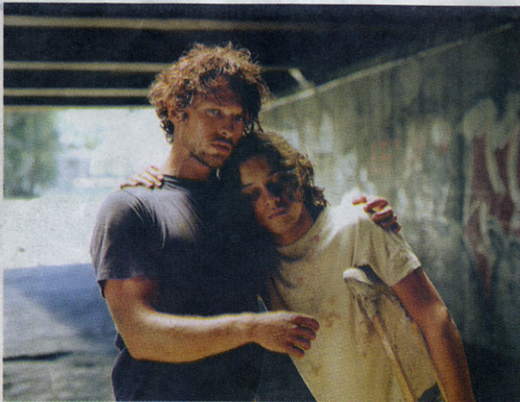
דוד ויהונתן. "לוקח אותי לימים של ההתעוררות המינית שלי"