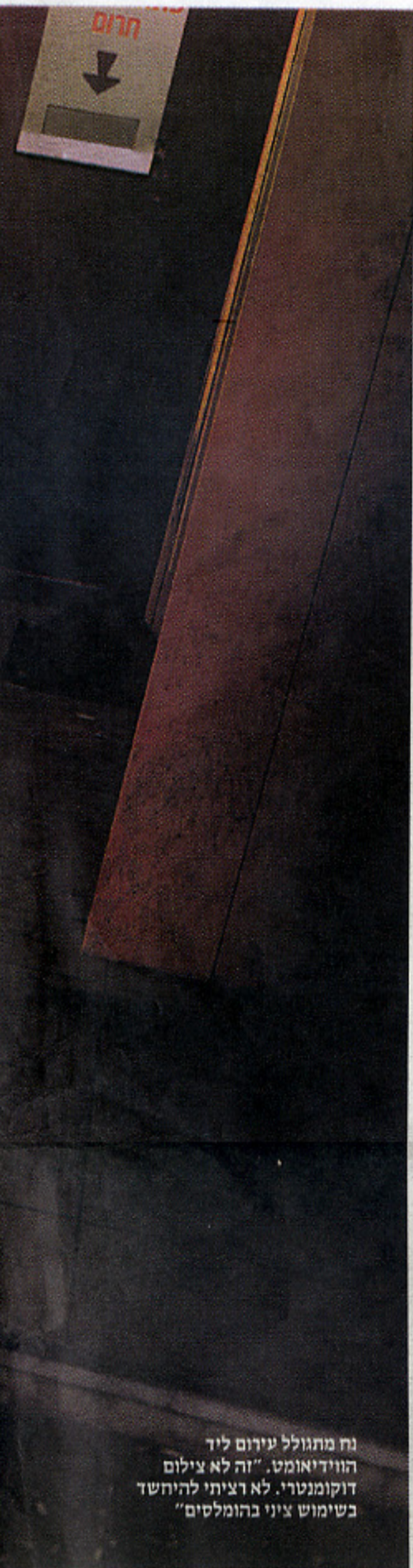
נח מתגולל עירום ליד הוודיאומט. "זה לא צילום דוקומנטרי. לא רציתי להיחשד בשימוש ציני בהומלסים"