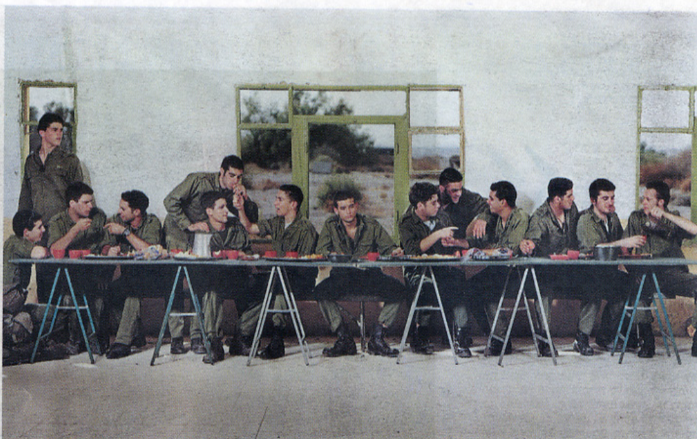
"הסעודה האחרונה", נמכרה תחילה ב-99' ב-1,500 דולר. "זה חמקמק ההצלחה, הפסגה"